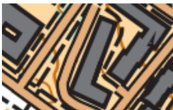
Recorte Mapant Leioa

- La parte del mapa del Parque de Artaza será ISOM 2008, Equidistancia 1 metro .