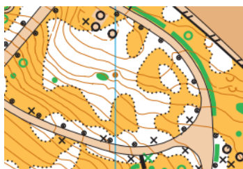
Recorte Parque de Artaza

- La parte del mapa del Parque de Artaza será ISOM 2008, Equidistancia 1 metro .