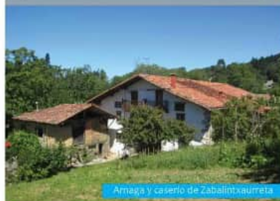
Amaia y caserío de Zabalintxaurreta

Patronato de la Reserva de la Biosfera de Urdaibai Torre Modariaga 94 403 23 60