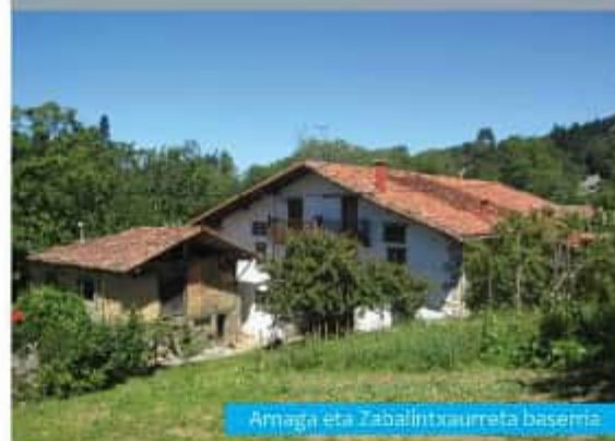
Amaga eta Zabalintzaurmeta baserria

Urdaibaiko Biosfera Erreserbako Patroiatua Madariaga dorretxea 94 403 23 60