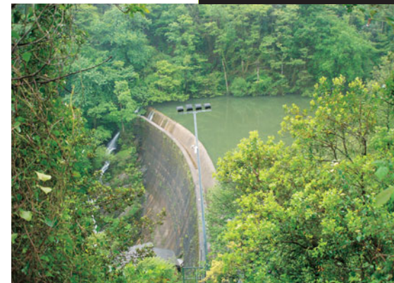
Detalle del muro de contención del embalse de Etxebarria

ciones desde donde, en diversos momentos, se tiene a la vista las laderas del monte Argalarrio. Una vez realizado el descenso hasta las orillas del río Castaños, tras haber remontado el pantano, habremos de cruzar el puente por la zona más alta. El recorrido está marcado por la pista, sencilla para caminar. Sin embargo, los más aventureros pueden seguir un estrechísimo sendero por la misma orilla del pantano, que alcanza la zona del muro de contención.