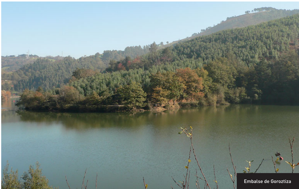
Embalse de Gorostitza